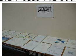
国語科・美術科 理科・家庭科部 美術部の 展示作品