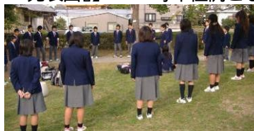
【2年3組・『明日への扉』】