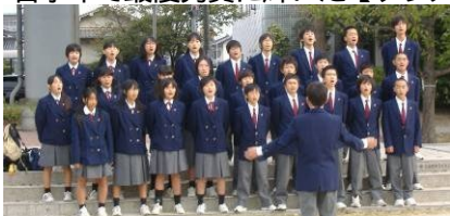
【1年1組・『夢の世界を』】

各学年で最優秀賞に輝いた【クラス・『発表曲』】・・・毎年恒例となっている当日朝の練習風景より