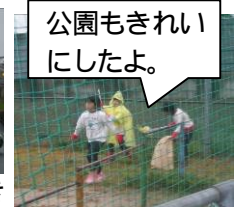
公園もきれい にしたよ。

12月3日(土)、本降りの冷たい雨がなんとかおさまり、予定どおり、ふれあいボランティア清掃を決定しました。とは言え、小雨が残っていたので、参加が少なくなるかと心配しましたが、108名もの小中学生が、1時間ほど熱心に活動してくれました。悪天候にもかかわらず、例年を大きく上回る参加があり、小学生の姿が、いつもより多かったです。親子で積極的に動いてくださったご家族や、子どもたちに声をかけながら活動して下さる地域の方もおられ、大変よい機会となりました。