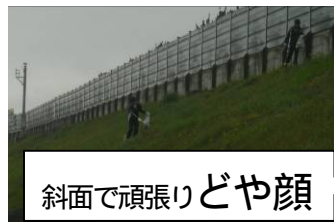
斜面で頑張りどや顔