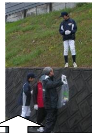
上 = 小学校の校長先生と 下 = 地域の方と